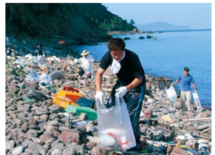
長尾田海岸での清掃活動の様子