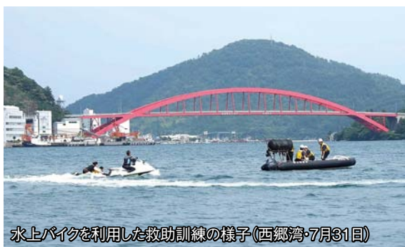
水上バイクを利用した救助訓練の様子（西郷湾・7月31日）

今後、海水浴やシーカヤックツアーなどの海浜利用者の安全確保や、自然環境保全活動及び、青少年のマリンスポーツ振興などへの貢献が期待されています。