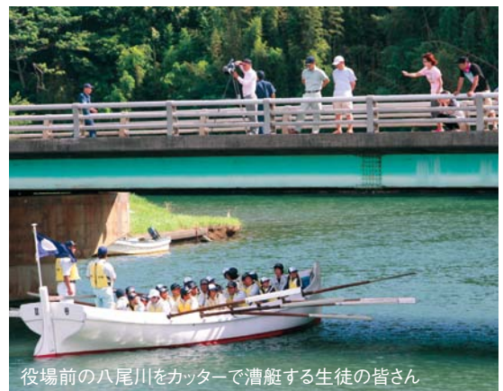
役場前の八尾川をカッターで漕艇する生徒の皆さん

海洋訓練は、海で仕事をするための基本的な技術や心構えを学ぶもので、整列の仕方や救助訓練のほか、4日間で約100キロメートルを超えるカッター漕艇などが行われました。