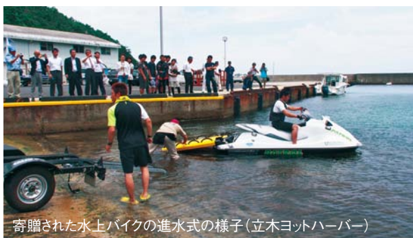
寄贈された水上バイクの進水式の様子（立木ヨットハーバー）