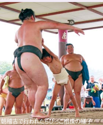
朝稽古で行われたちびっこ相撲の様子