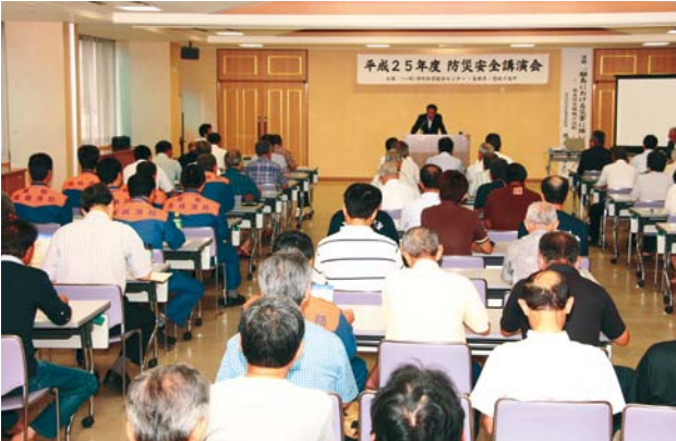
大勢の方が来場した講演会の様子(役場ふれあいセンター)

現在、本町の自主防災組織の設置率は県下で最低の8.4%(例：松江市58.9%、出雲市92.8%)となっており、参加した皆さんは、自主防災組織を通じた地域防災力の向上について意識を高めました。