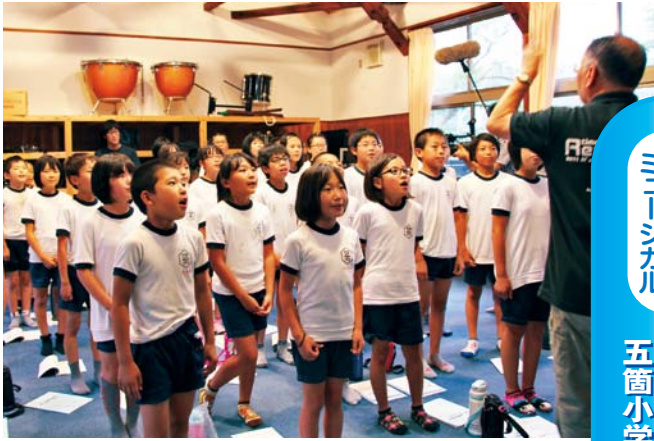
五箇小学校の初稽古の様子(7月4日)

「あいと地球と競売人」10月に隠岐公演決定 五箇小学校児童が地元キャストで出演!