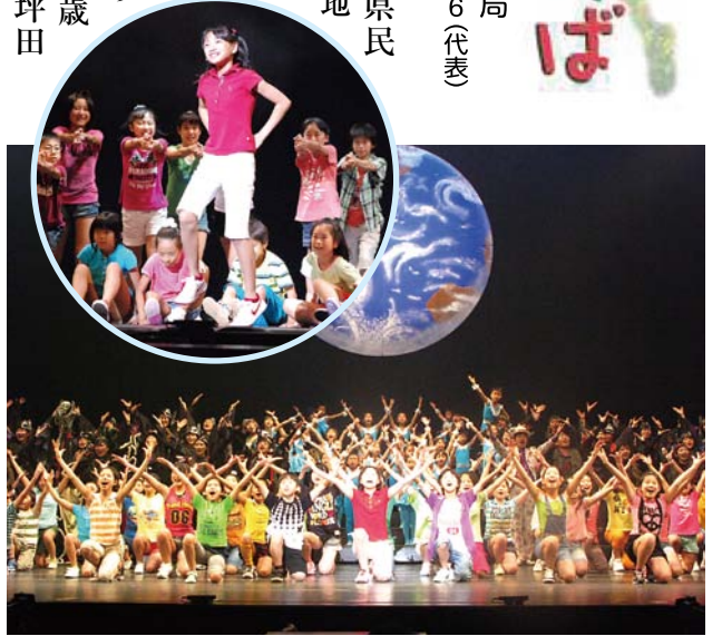
過去の公演の一場面

このミュージカルは、地球環境保護を訴えたマンガ「地球の秘密」を描き、わずか12歳で亡くなった出雲市斐川町の坪田