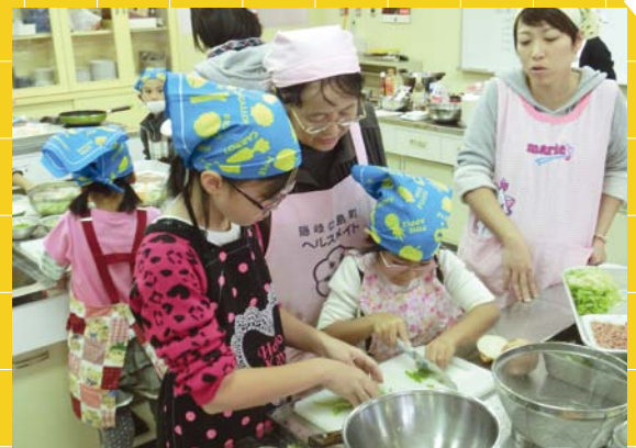
▲食生活改善推進員による「親子クッキング教室」が、各地区で行われています。

一緒に買い物に行き、様々な食べ物を、見たり選んだりしましょう。そして、親子で作ったものを一緒に食べ、おいしさを共感することが大切です。 毎日の食事作りのお手伝いをしてもらうことで、調理する習慣をつけ、食べ物を作ってくれる人々に感謝する心を育てましょう。