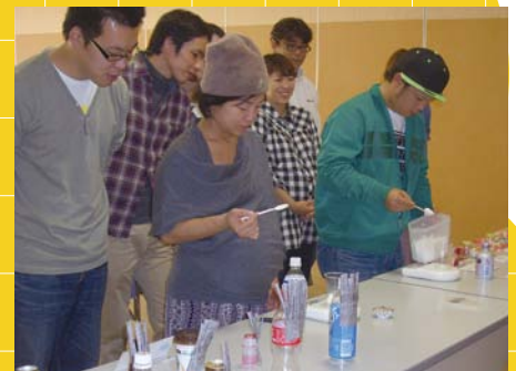
▲町では、妊婦とその家族を対象とした「プレママ・プレパパ教室」を開催し、朝食の重要性や、望ましい食生活についてアドバイスをしています。

朝ごはんは、1日の始まりにかかせないものです。少しだけ早起きをして、しっかりと朝食を食べて出かけましょう。 まずは、家族みんなで、正しい生活リズムを習慣づけることが大切です。