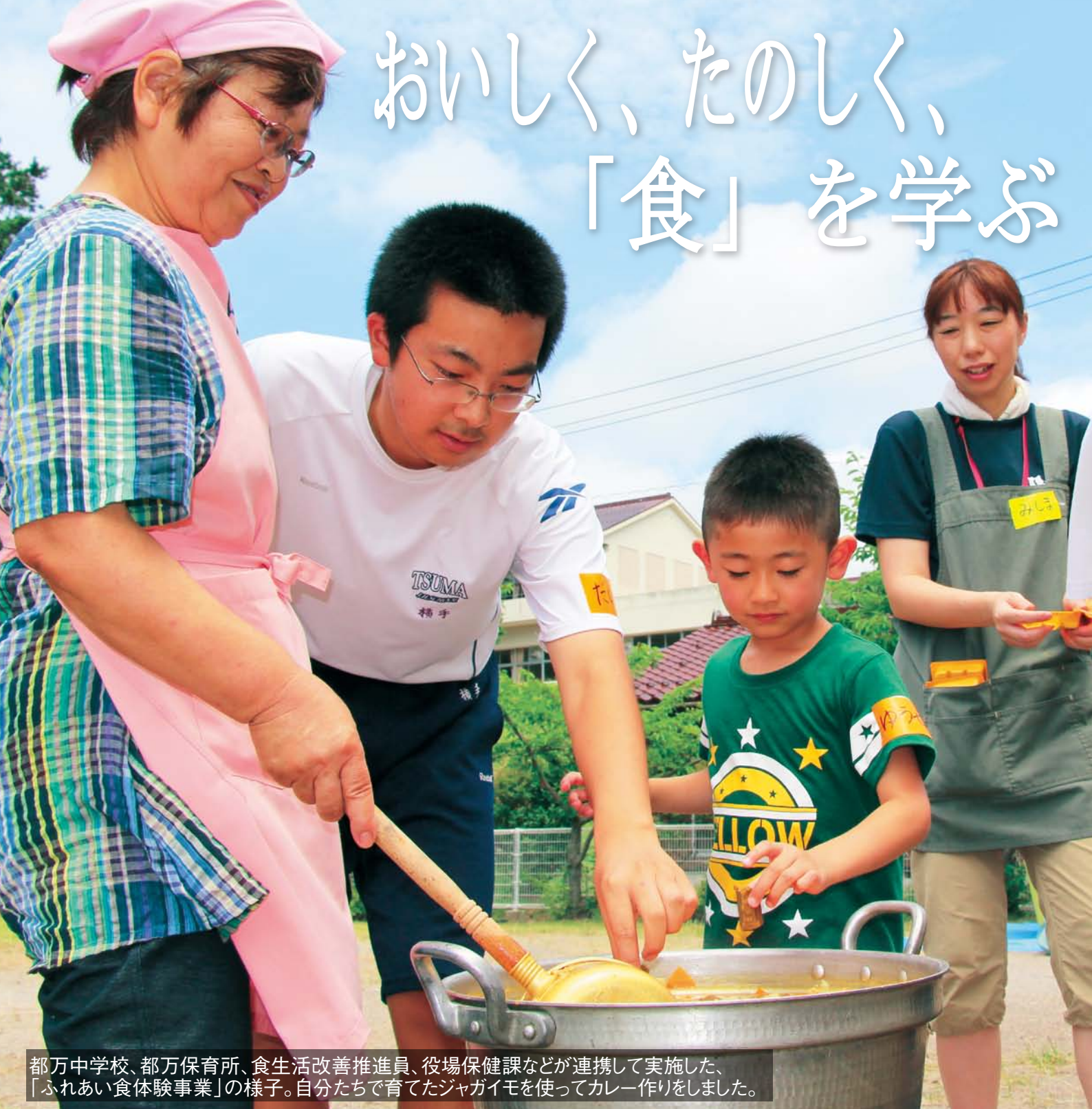
都万中学校、都万保育所、食生活改善推進員、役場保健課などが連携して実施した、「ふれあい食体験事業」の様子。自分たちで育てたジャガイモを使ってカレー作りをしました。