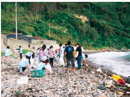
大津久海岸での清掃活動の様子

隠岐の島町では、初めての開催でしたが、隠岐高校の生徒13名と韓国から訪れた17名の中学生は、ごみを拾いながら、漂着ごみの実態について学んでいました。