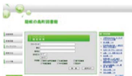
ホームページの蔵書検索画面

( http://www.town.okinoshima.shimane.jp/to-shokan/ )