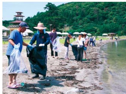
塩の浜海岸での清掃活動の様子